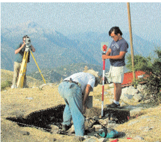
In alto: gli scavi sul Monte Liceo. A destra: il sigillo minoico (1500 a.C. circa) con raffigurazione di un toro, rinvenuto sul Monte Liceo.