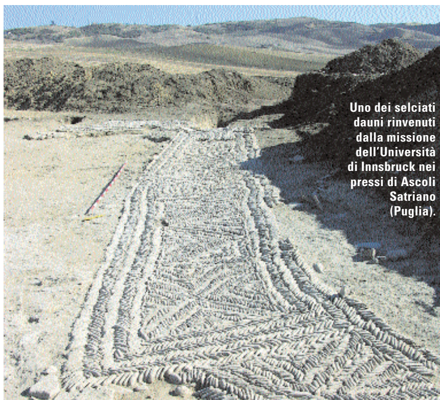
Uno dei selciati dauni rinvenuti dalla missione dell'Università di Innsbruck nei pressi di Ascoli Satriano (Puglia).

Un'origine protostorica che potrebbe benissimo valere anche per il santuario del Monte Liceo. Con buona pace del padre degli dèi.