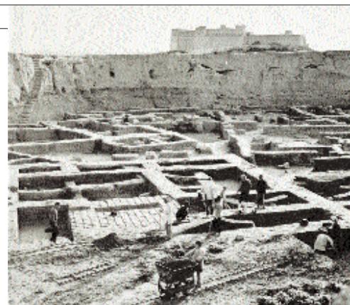
Gli scavi di Susa, in una foto del 1958.

Secondo Mojtaba Gahestuni, portavoce della Società per i beni culturali del Kuzistan, le distruzioni sono da imputare all'assenza di un'adeguata recinzione del sito. L'integrità dell'Apadana di Susa, prosegue la denuncia di Gahestuni, è inoltre minacciata dalla costruzione di una scuola elementare e di una fermata di autobus proprio nei pressi delle antiche rovine. Un appello per la salvaguardia del sito è stato inviato al presidente iraniano Mahmud Ahmadinejad.